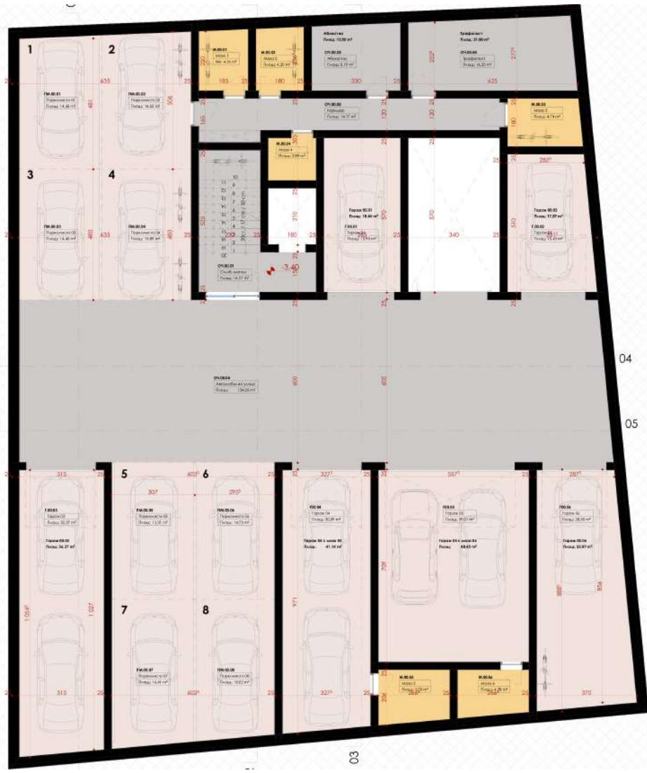
ТАБЛИЦА НА ПОМЕЩЕНИЯТА НА КОТА - 3.40