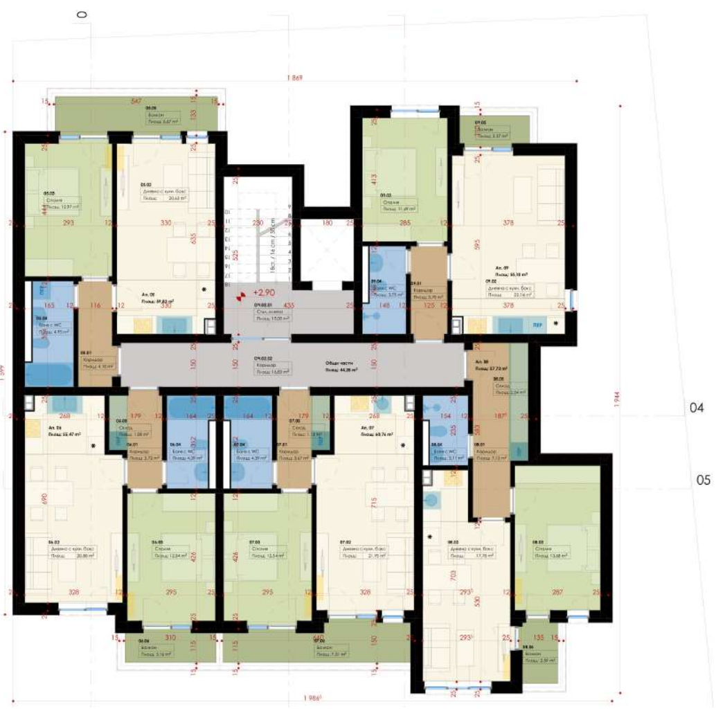
ТАБЛИЦА НА ПОМЕЩЕНИЯТА НА КОТА + 2.90