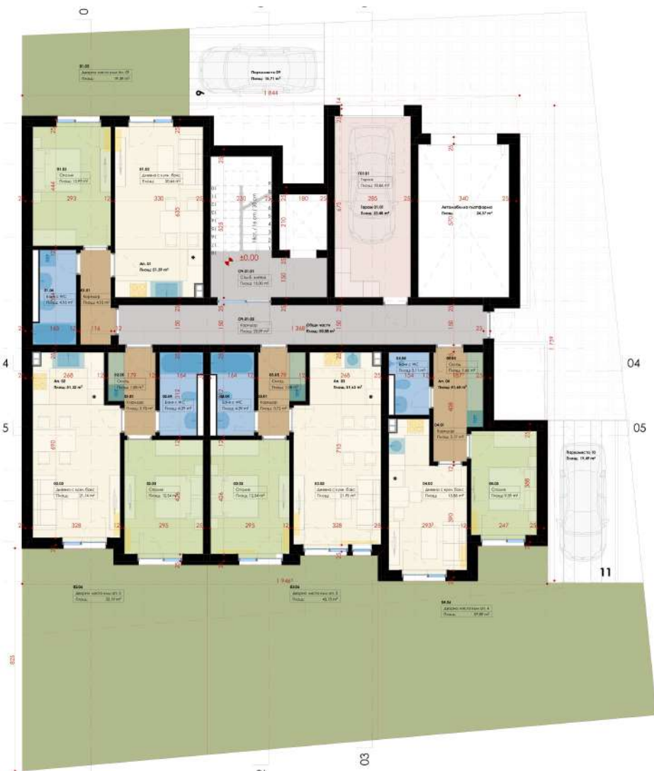
ТАБЛИЦА НА ПОМЕЩЕНИЯТА НА КОТА ± 0.00