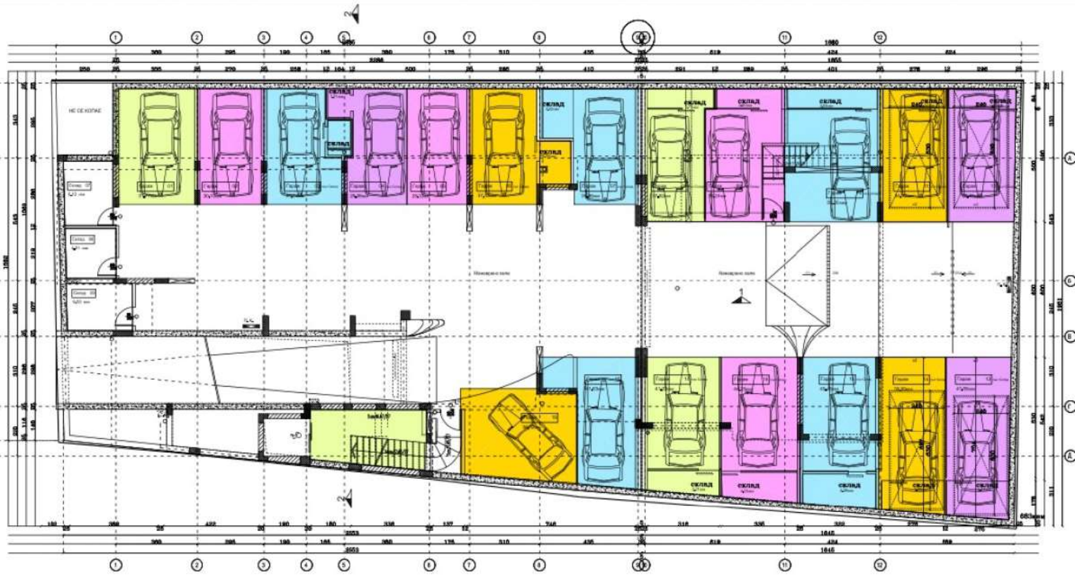
План на подземен етаж