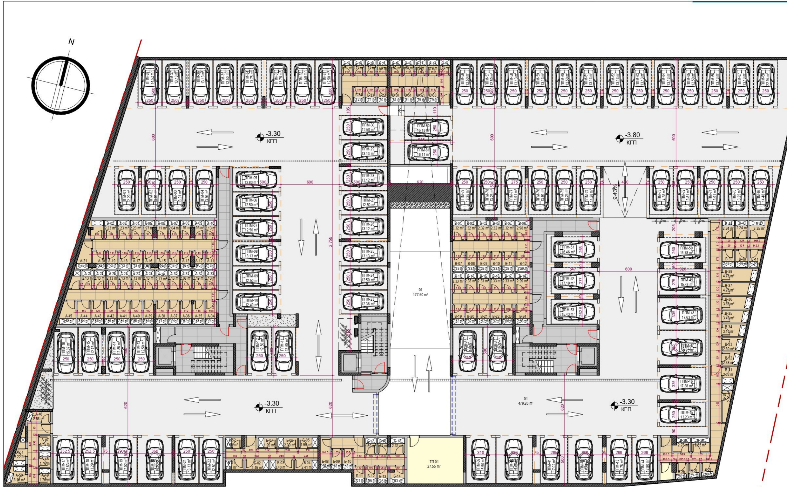
Разделение сутерен кота -3,30